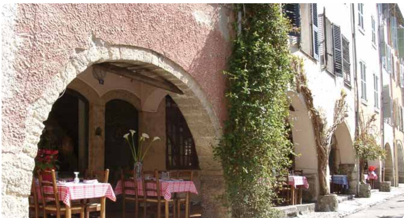
Biot, Place des Arcades