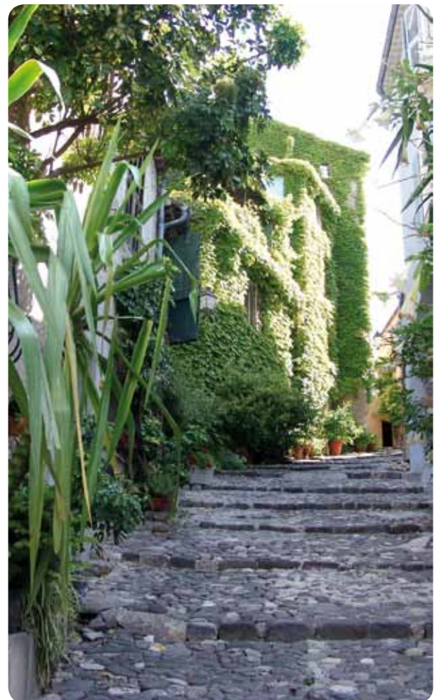
Biot, Ruelle Village