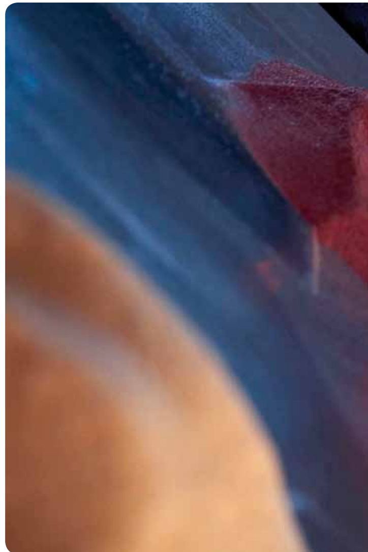
Verre en fusion