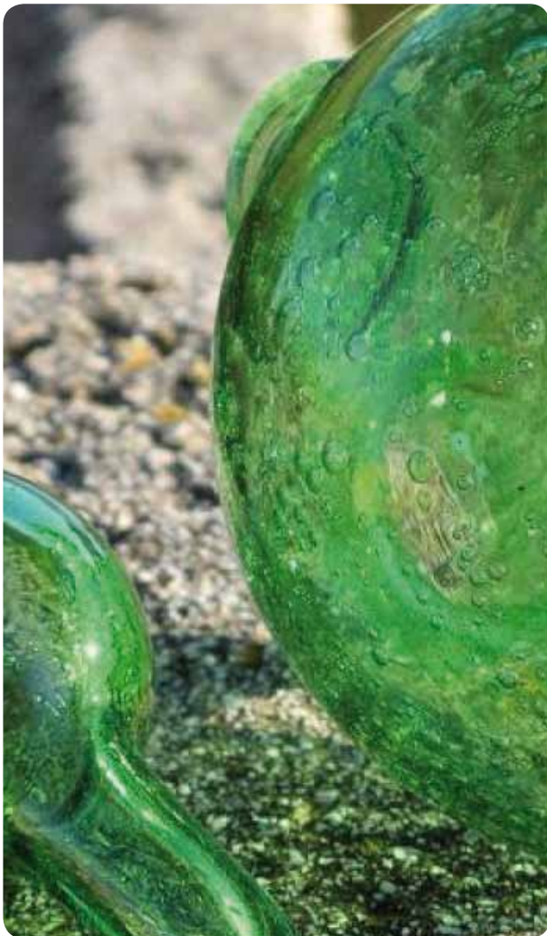
Biot, Verreries

was located on the square in front of the church's entrance. The Biot commandery was one of the most important all over Eastern Provence. By heritage and areas bought, the Knight Templars made the Biot territory unity. Knight Templars were skilled farmers. In 1308, the Knight Templar(s) Order was destroyed by order of the Pope. Two Templars were arrested in Biot. The Hospitallers of St John of Jerusalem (became the Malta Knights in 1530) replaced the Knight Templars and, with the Bishop of Grasse, were Lords of Biot and ruled the village until the French Revolution.