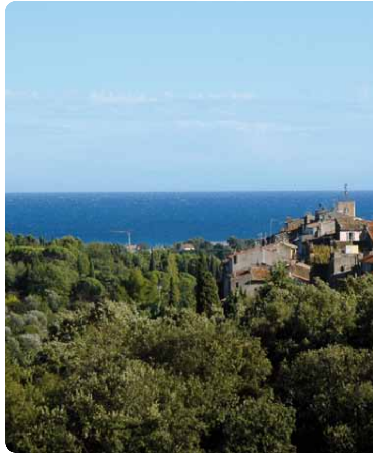
Biot village vue mer

10 • TAKE A RIGHT TURN THROUGH THE ARCH leading to the "Portes des Tines" (1565) and observe the sealed