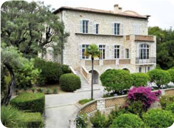
Cagnes-sur-Mer, Maison Renoir