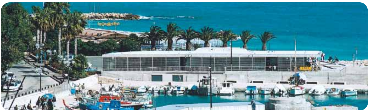
Cagnes-sur-Mer, Le Port

En arrivant à la gare routière de Cagnes-sur-Mer deux possibilités s'offrent à vous, vous pouvez emprunter la navette n°49 en descendant à l'arrêt Musée Renoir ou vous rendre à pied au musée (10 min) à pied en empruntant le chemin suivant : avenue des tuilières puis chemin des Collettes.