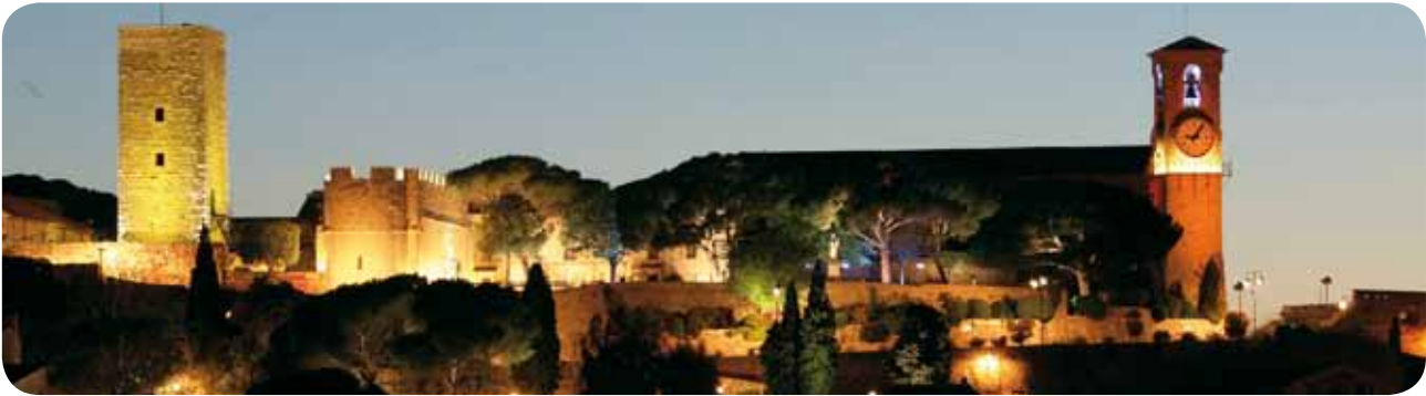
Cannes, Le Suquet