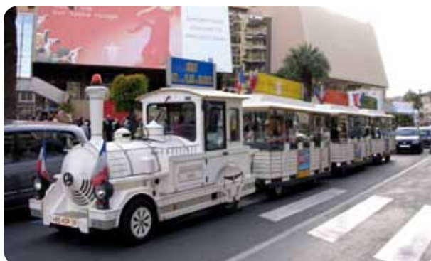
Cannes, Le petit Train

Tarif individuel : 6€. Gratuit 1 er dimanche de chaque mois d'octobre à avril inclus.