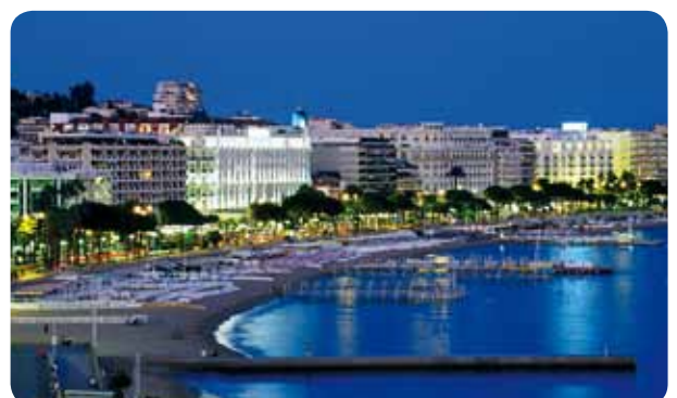
Cannes, Croisette de nuit