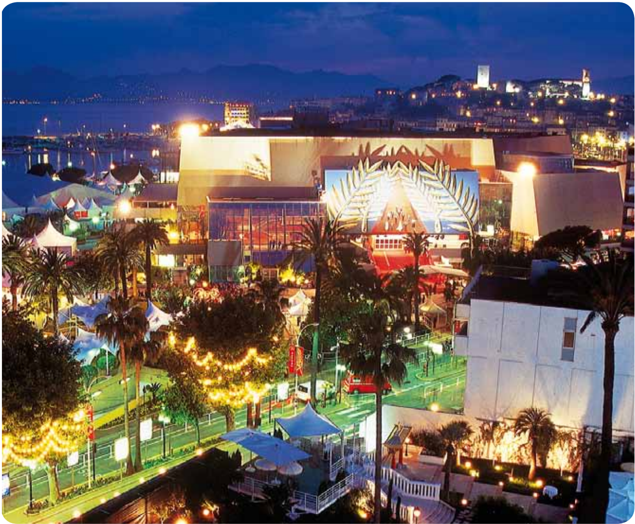
Cannes Palais des Festivals