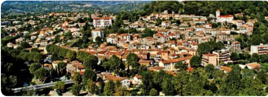
Le Village CT Villeneuve-Loubet (M1)