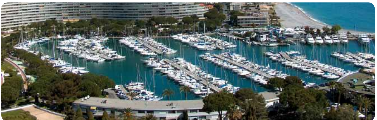
Marina Baie des Anges

Sur l'avenue de Bellevue, longez les remparts du château en redescendant du côté gauche en direction du cimetière. Elle commémore vraisemblablement la prise de l'ancien château du Gaudalet. Du parvis, on jouit d'un magnifique panorama sur les Pré-Alpes.