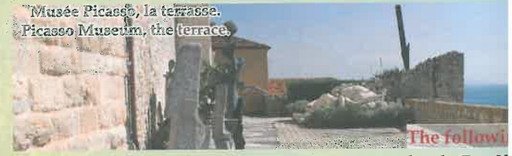
Musée Picasso, la terrasse. Picasso Museum, the terrace.