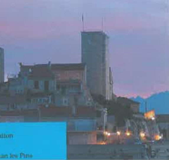
Antibes, les remparts